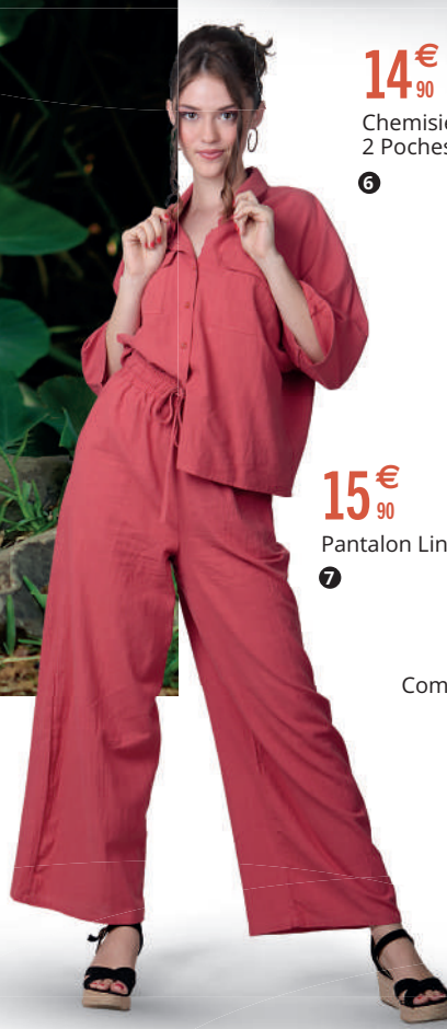
14€ 90 Chemisier Lin 2 Poches