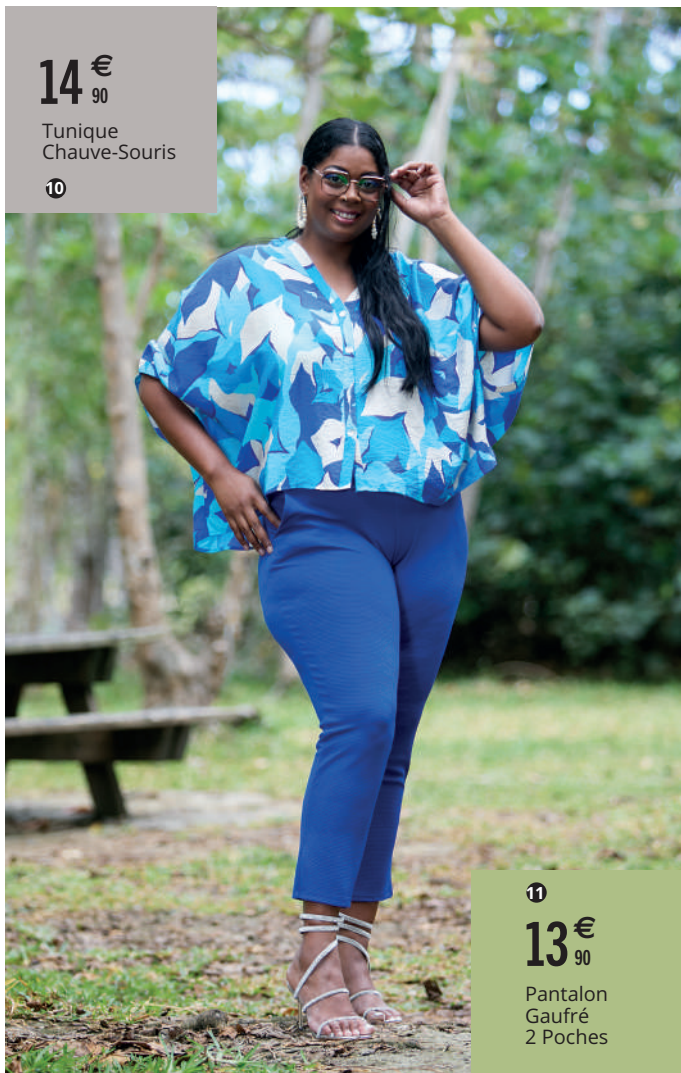
14€ 90 Tunique Chauve-Souris 10