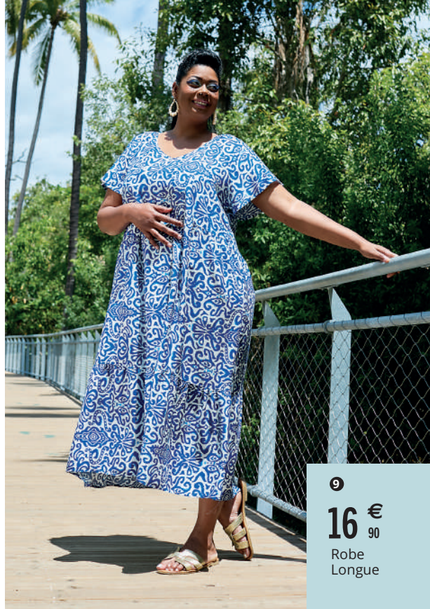
9 16€ 90 Robe Longue